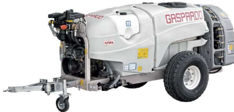
سمپاش باغی توربو کششی