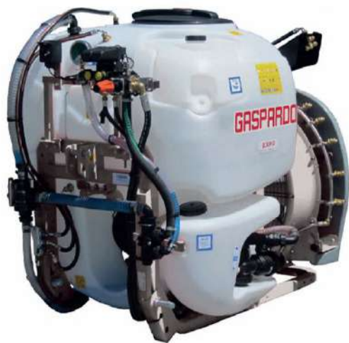
سمپاش باغی توربو سوار