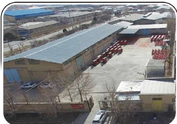
شرکت ماشین برزگر خاوری