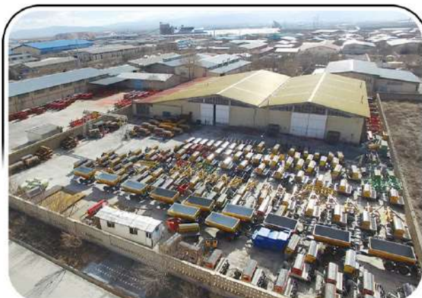
شرکت ماشین برزگر همدان